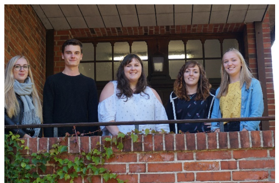
Das Team der Azubis der Samtgemeinde Elbtalaue, Stand 01.08.2018